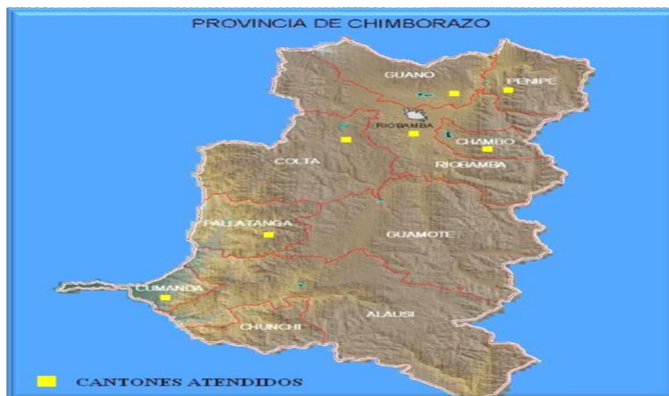
Gráfica 4. Cantones atendidos por las VRC

Los Cantones de la Provincia de Chimborazo y en especial el Cantón Penipe, en el cual ha incursionado VRC en sus inicios, ha sido históricamente relegados de servicios financieros, si bien existe una población considerable en todas las parroquias rurales de este Cantón (refiérase al gráfico 4 para su ubicación geográfica), éstas no han podido acceder a servicios financieros por la cantidad de documentos exigidos, además de los altos costos de transacción, lo cual ha ocasionado que no exista un flujo mayoritario de personas con experiencia crediticia. El difícil acceso a sectores rurales es otro factor que impide que las personas puedan mejorar su calidad de vida por todos los gastos que implica trasladarse de un lugar a otro sin tener los medios necesarios.