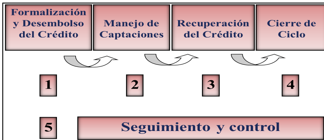
Gráfica 8. Operación de la Ventanilla Rural Cooperativa